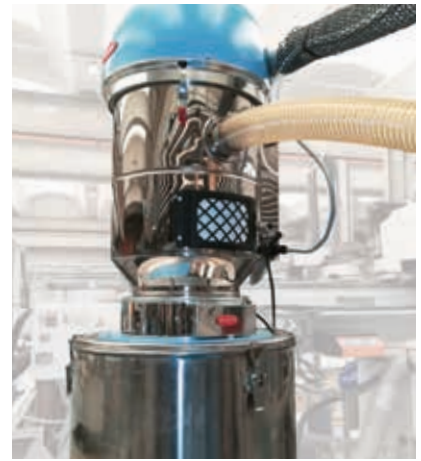
Counter Installation. Counter installato.

In line weighing system Sistema di pesatura In line