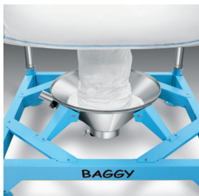
Example of use of thrust loading unit. Esempio di impiego del gruppo in spinta.