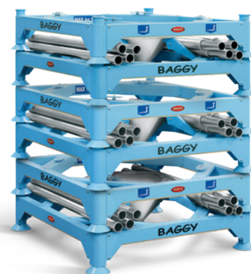
Modular stackable structure. Struttura modulare impilabile.