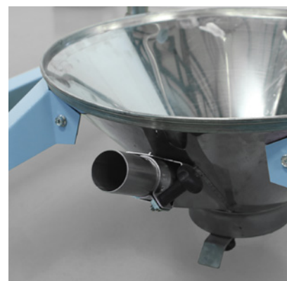
Suction valve. Valvola di aspirazione.

4.70.970.4 - Reproduction and/or copying, even partial, are forbidden without written authorization by Moretto S.p.A.