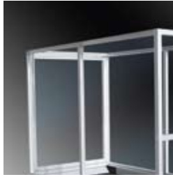
A richiesta: protezione Optional: protection guard