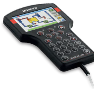
Master 300 palm-top (optional). Master 300 bedieningsterminal (optioneel)