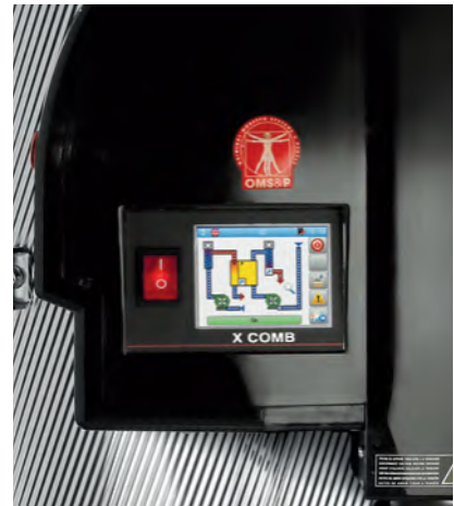
Touch view control. Bedieningsschem.