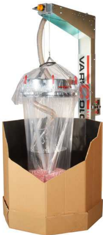
Legen van Octabins