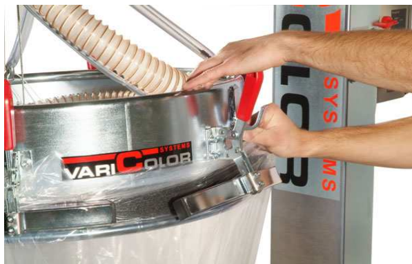
Klemmen voor plastic binnenzak (liner)