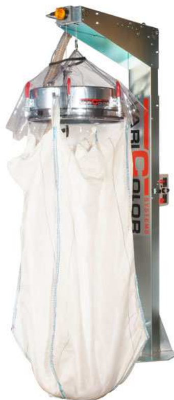
Legen van big-bags