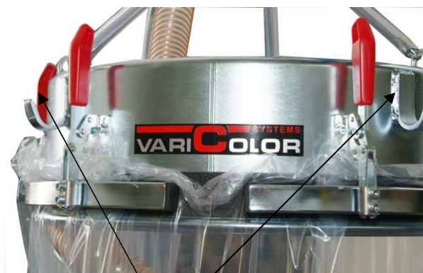
Haken voor big-bags